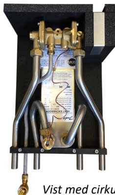
Vist med cirkulationskit